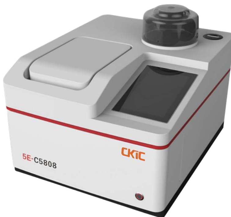
Рисунок 1 – Общий вид калориметра бомбового автоматического 5E-C5808

Калориметрический блок является основой калориметра, содержащей конструкционные элементы калориметрической системы, предназначенные для проведения калориметрического анализа: дисплей для настройки конфигураций и отображения данных, калориметрическая бомба, калориметрический сосуд, блок термостатирования, измерительные электронные схемы, датчики аварийных сигналов, управляющий микроконтроллер и интерфейс связи с ПК. Общий вид калориметров бомбовых 5E-C5808 представлен на рисунке 1. Заводской номер калориметра наносится в цифровом виде на оцинкованную табличку, расположенную на боковой стенке калориметра, для обеспечения идентификации каждого экземпляра средства измерений и сохранности номера в процессе эксплуатации (рисунок 2). Доступ к внутренним частям калориметра опломбирован. Нанесение знаков утверждения типа СИ и поверки на СИ не предусмотрено.