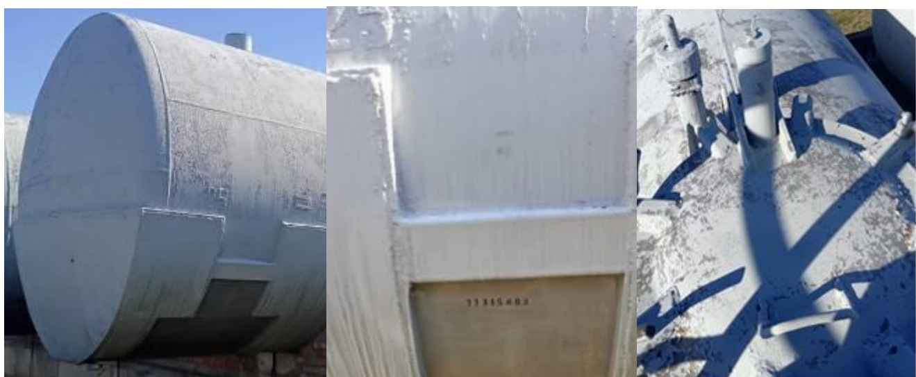
РГС-60 зав. № 77315493