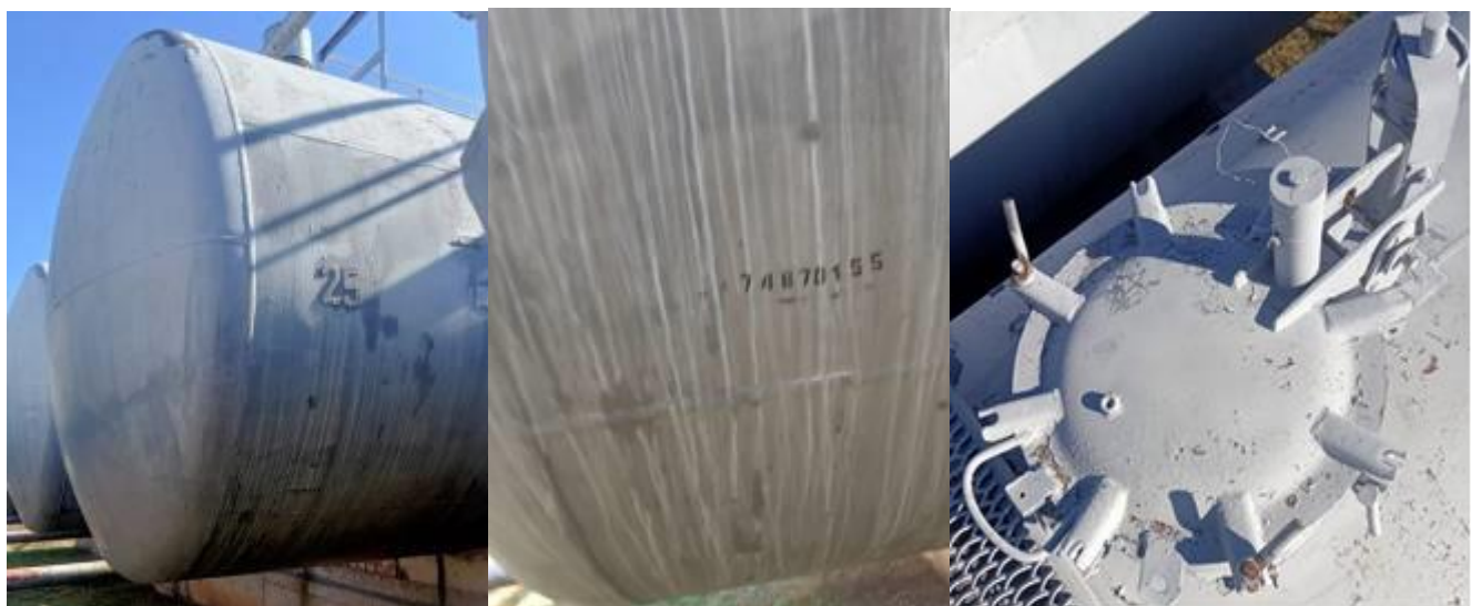
РГС-60 зав. № 74870155