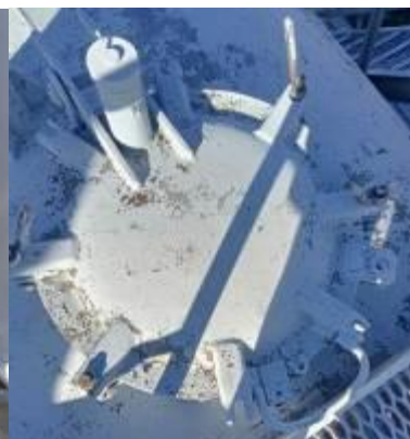
РГС-140 зав. № 79021762