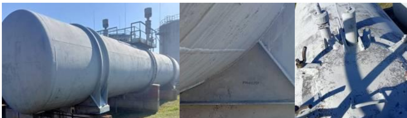
РГС-140 зав. № 79043251