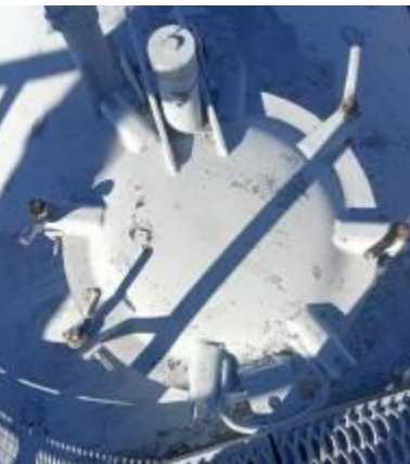
РГС-140 зав. № 79032376