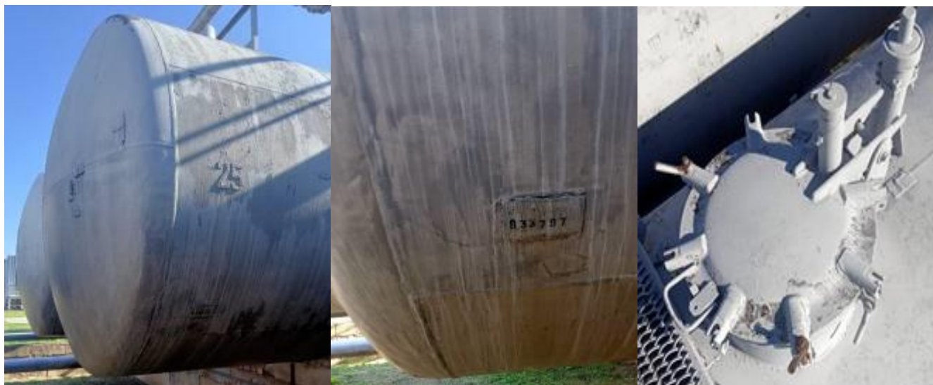
РГС-60 зав. № 933797