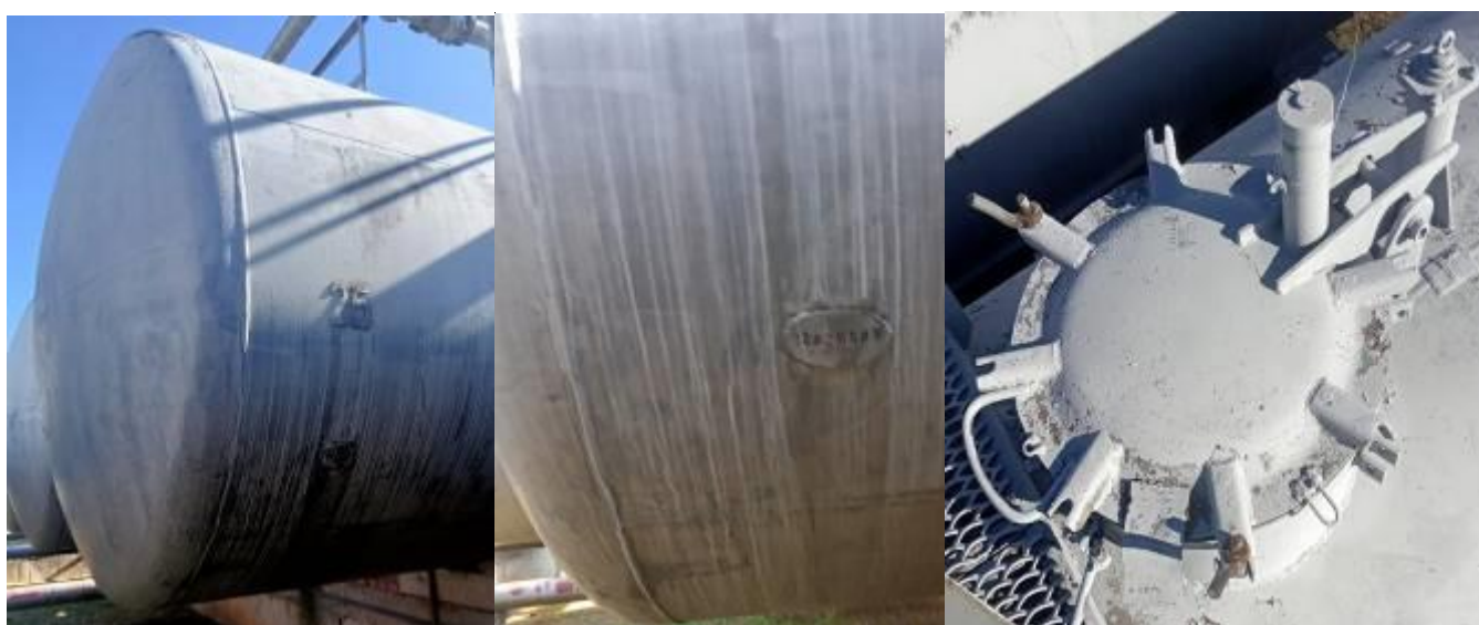
РГС-60 зав. № 7282059