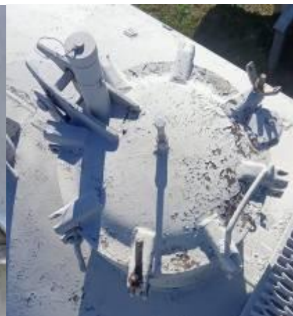
РГС-140 зав. № 79012795