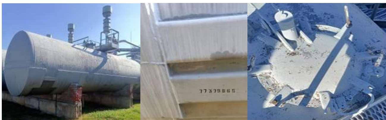
РГС-60 зав. № 77379865