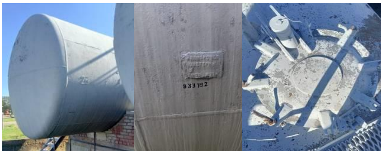
РГС-60 зав. № 933792