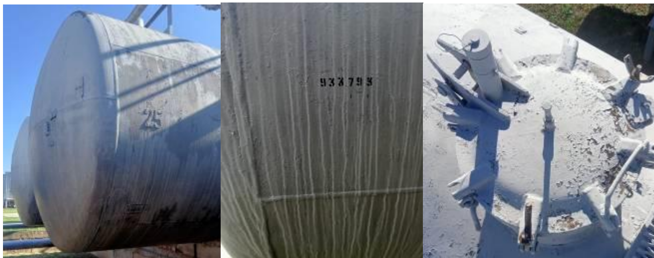
РГС-60 зав. № 933793