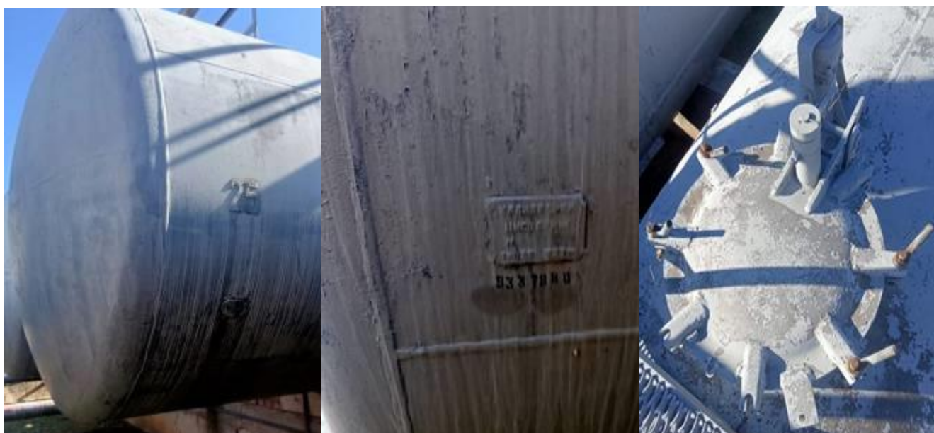
РГС-60 зав. № 9337890