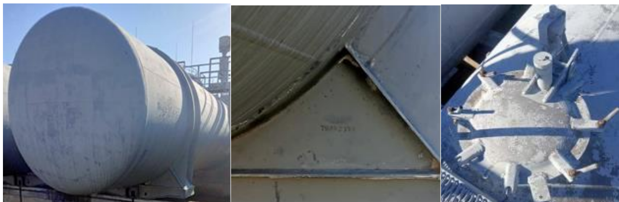
РГС-140 зав. № 79033791