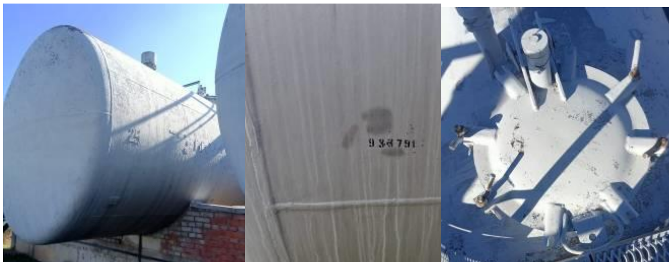
РГС-60 зав. № 933791