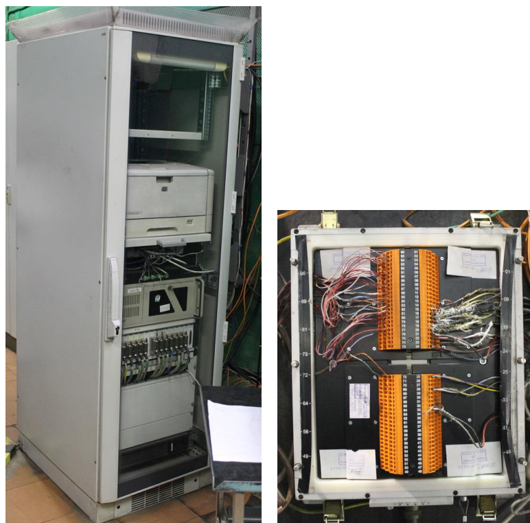
Р и с у н о к 2 – Общий вид приборных шкафов

Защита от несанкционированного доступа к компонентам ИС обеспечивается ограничением доступа к месту ИС и запираем приборных шкафов на замок. Нанесение знака поверки на ИС не предусмотрено.