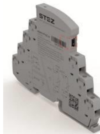
Рисунок 2 – Общий вид преобразователей в корпусах 7 мм с указанием места нанесения серийного номера