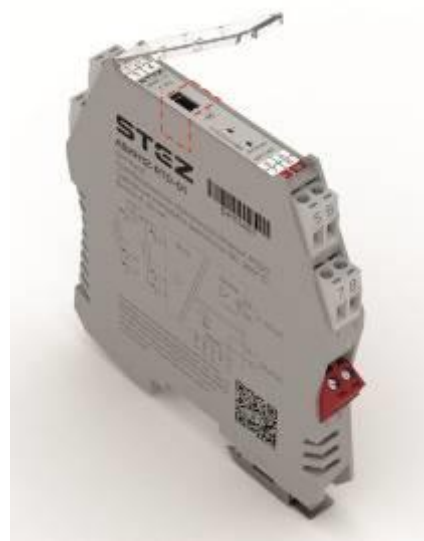
Рисунок 1 – Общий вид преобразователей в корпусах 12,5 и 17,5 мм с указанием места нанесения серийного номера