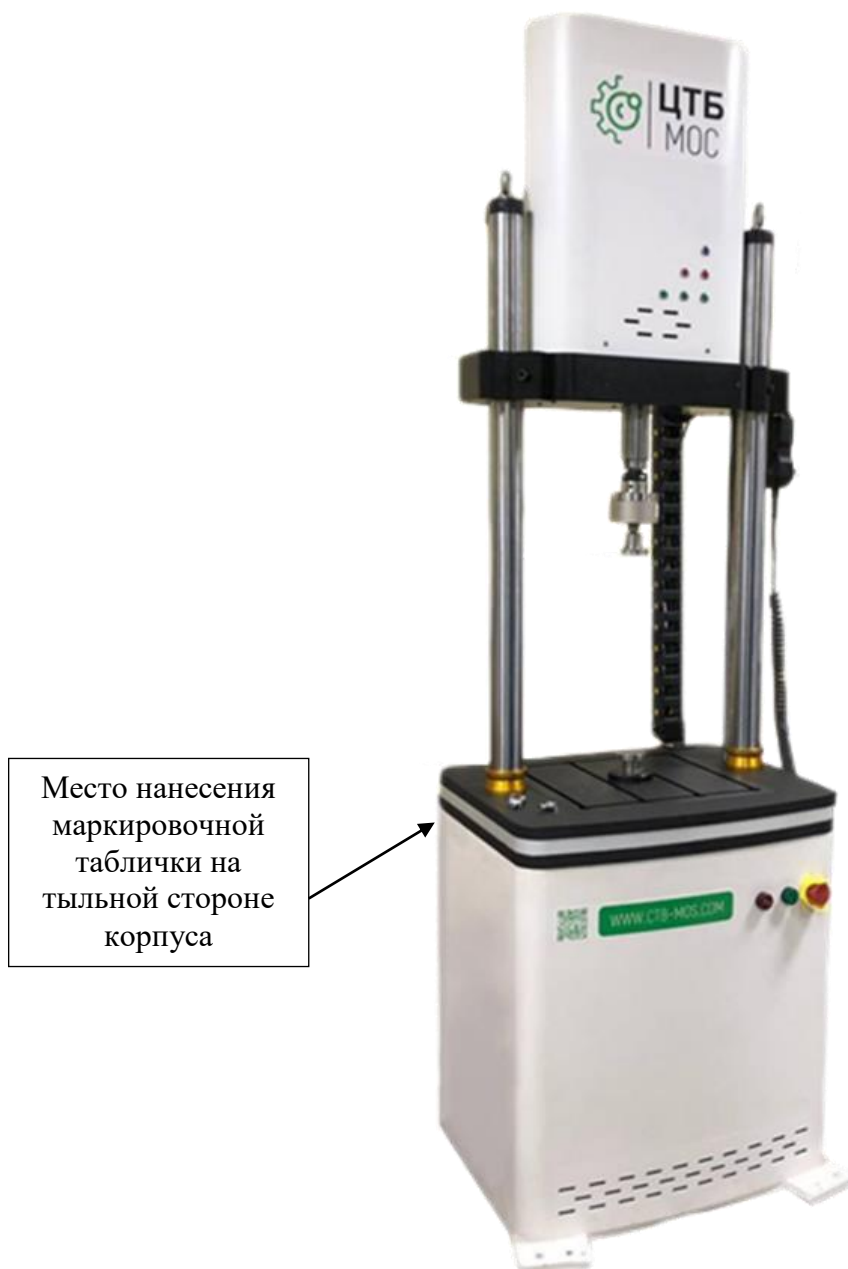
Рисунок 1 – Общий вид машин испытательных динамических МИД ЦТБ

Общий вид машин приведён на рисунке 1. Внешний вид модулей машины приведён на рисунках 2 – 3. Общий вид маркировочной таблицы приведён на рисунке 4.