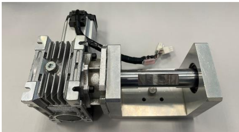
Рисунок 3 – Внешний вид модуля вращения