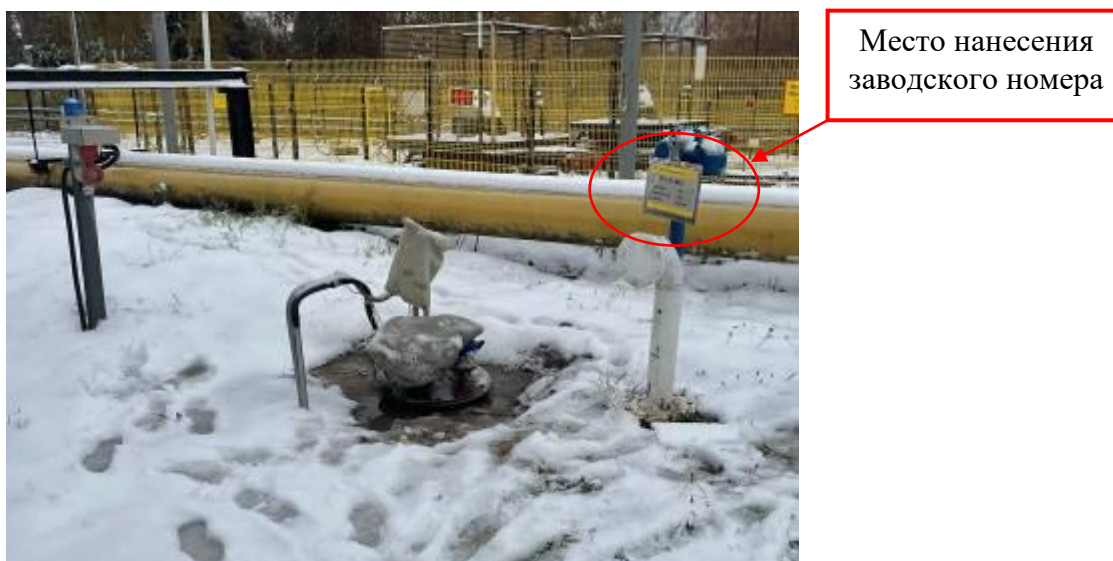
Рисунок 2 – Общий вид заливной горловины РГС-22 зав.№ 11