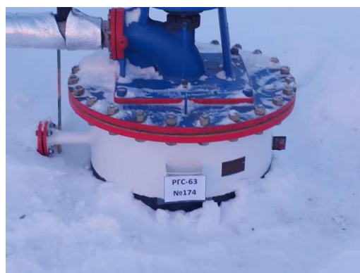
Рисунок 2 – Фотографии мест нанесения заводских номеров резервуаров PFC-63 Фотографии замерных люков резервуаров представлены на рисунке 3.