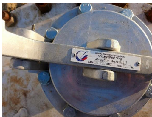
Рисунок 3 – Фотографии замерных люков резервуаров PFC-63