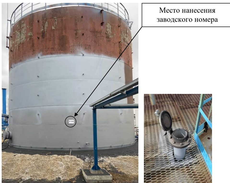
Р и с у н о к 2 – Общий вид резервуара с заводским номером P-318 и его замерного люка