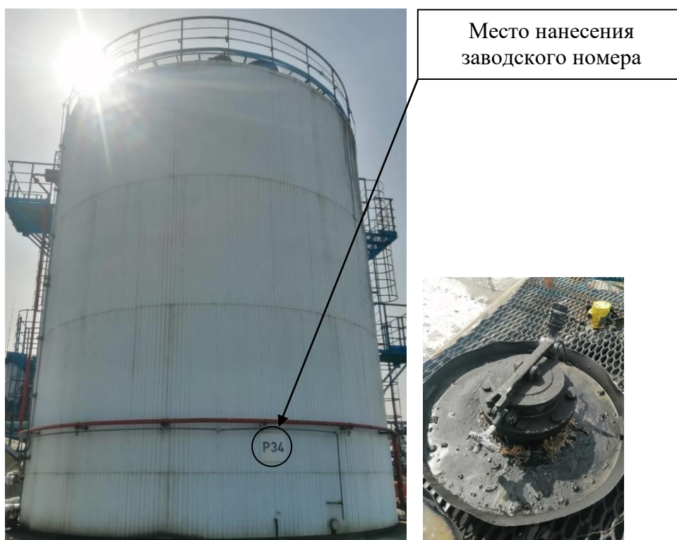
Р и с у н о к 2 – Общий вид резервуара с заводским номером P34 и его замерного люка