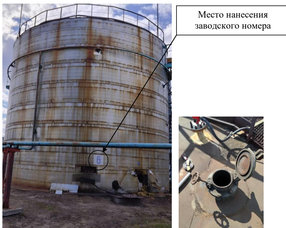
Р и с у н о к 1 – Общий вид резервуара с заводским номером 6 и его замерного люка