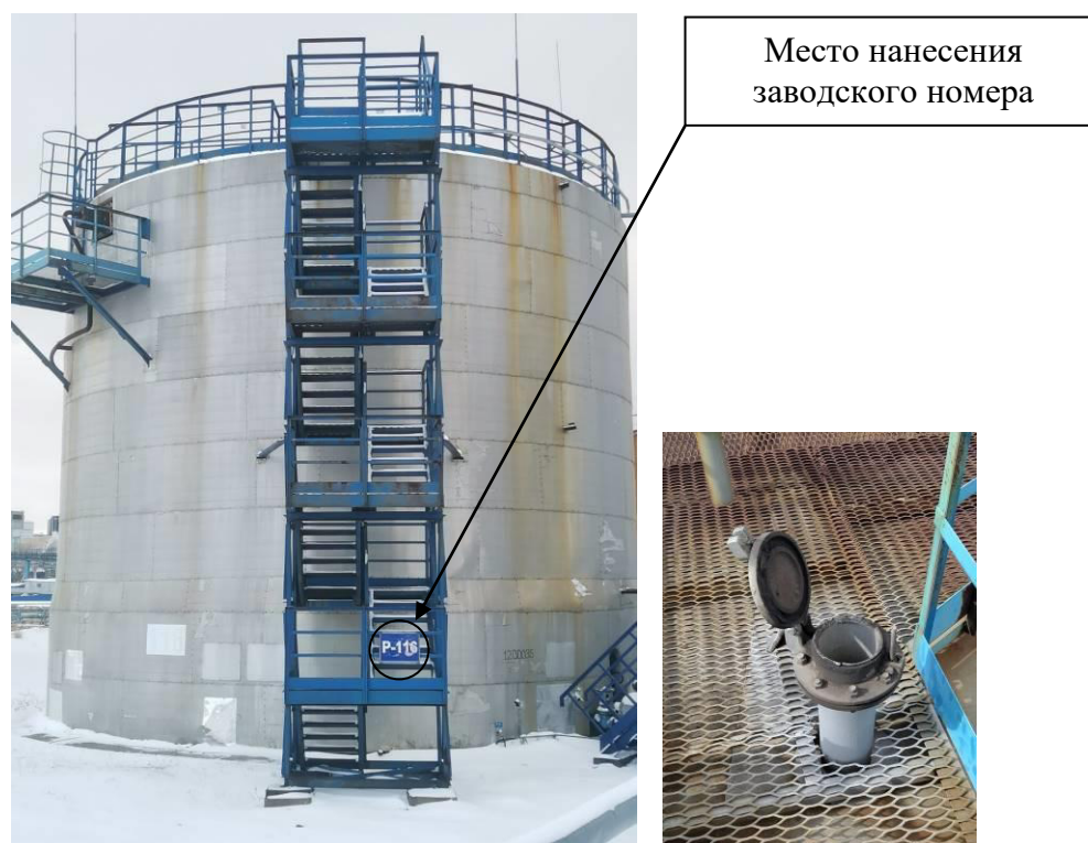
Р и с у н о к 3 – Общий вид резервуара с заводским номером P-116 и его замерного люка