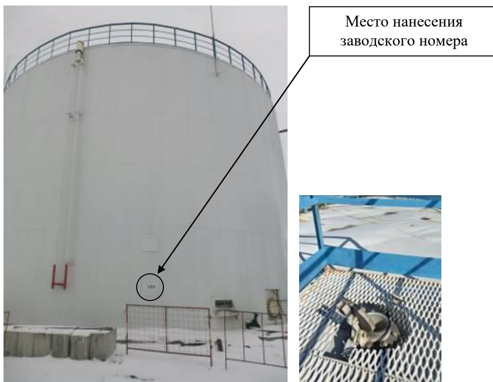
Р и с у н о к 3 – Общий вид резервуара с заводским номером 105 и его замерного люка