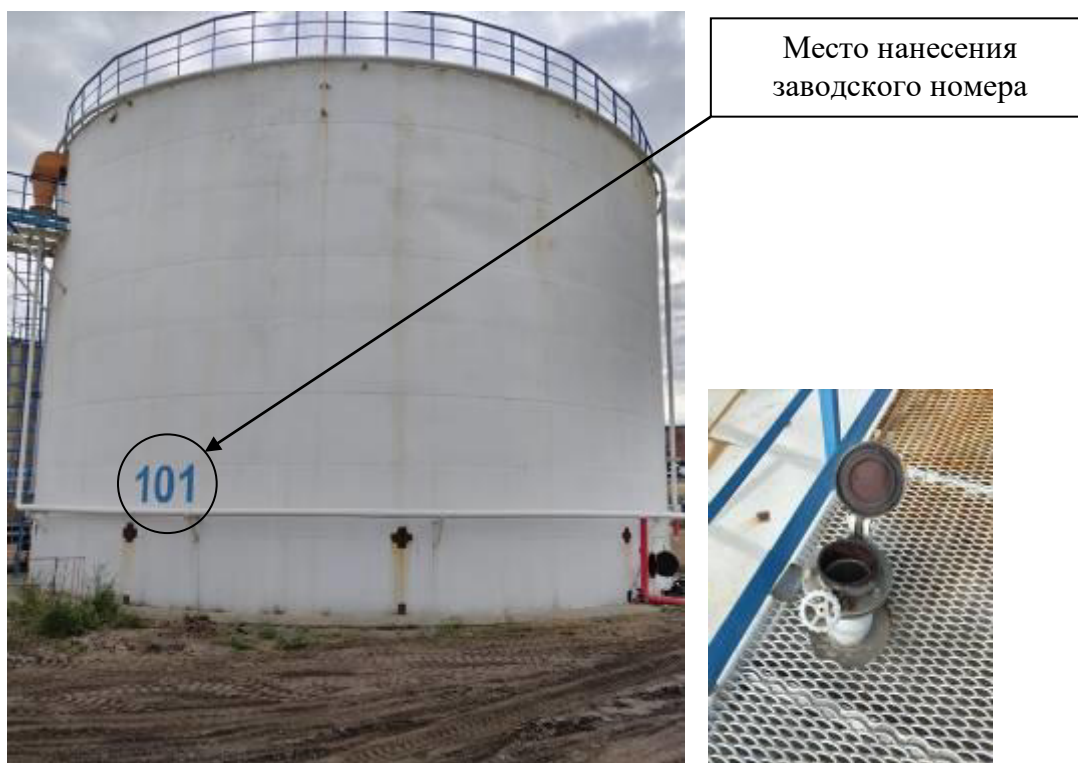
Р и с у н о к 1 – Общий вид резервуара с заводским номером 101 и его замерного люка