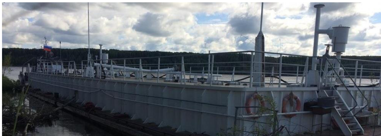
Р и с у н о к 1 – Общий вид нефтеналивной баржи СТГН-602

Общий вид нефтеналивной баржи СТГН-602 представлен на рисунке 1.