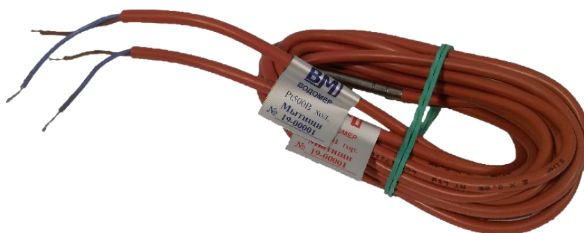
Рисунок 1 – Общий вид комплекта термопреобразователей сопротивления Pt 500 BM

Общий вид комплекта КТСП приведены на рисунке 1.