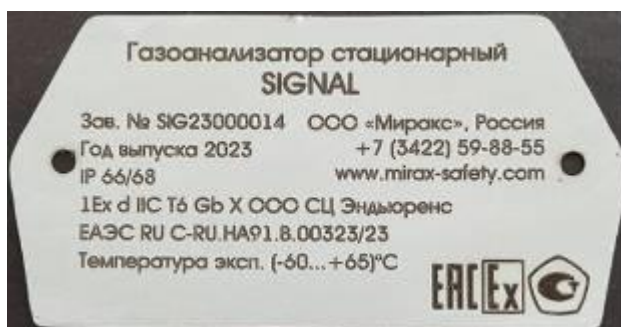
Рисунок 2 – Макет шильда газоанализаторов стационарных SIGNAL