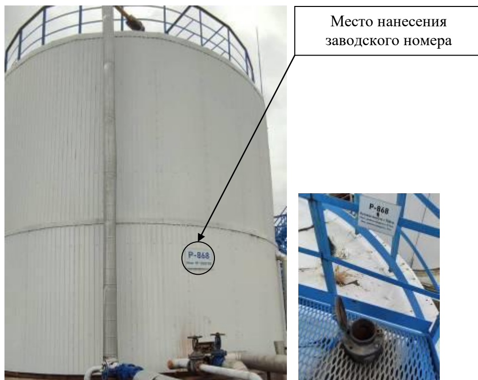
Р и с у н о к 5 – Общий вид резервуара с заводским номером P-868 и его замерного люка