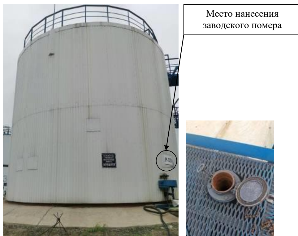
Р и с у н о к 4 – Общий вид резервуара с заводским номером P-327 и его замерного люка