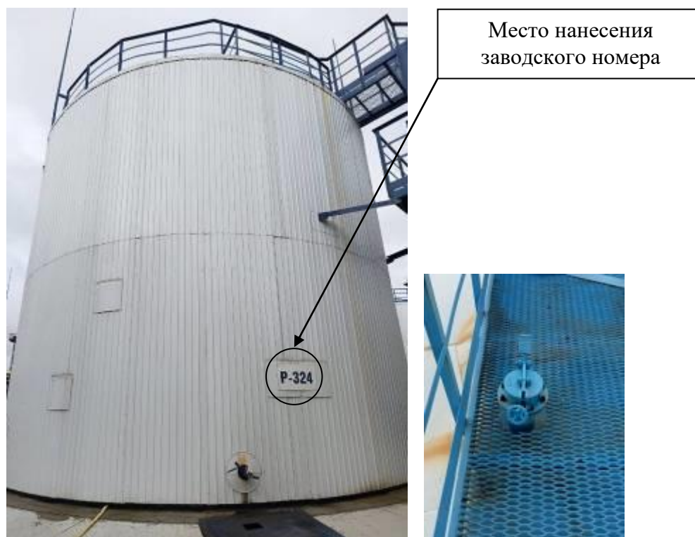
Р и с у н о к 3 – Общий вид резервуара с заводским номером P-324 и его замерного люка