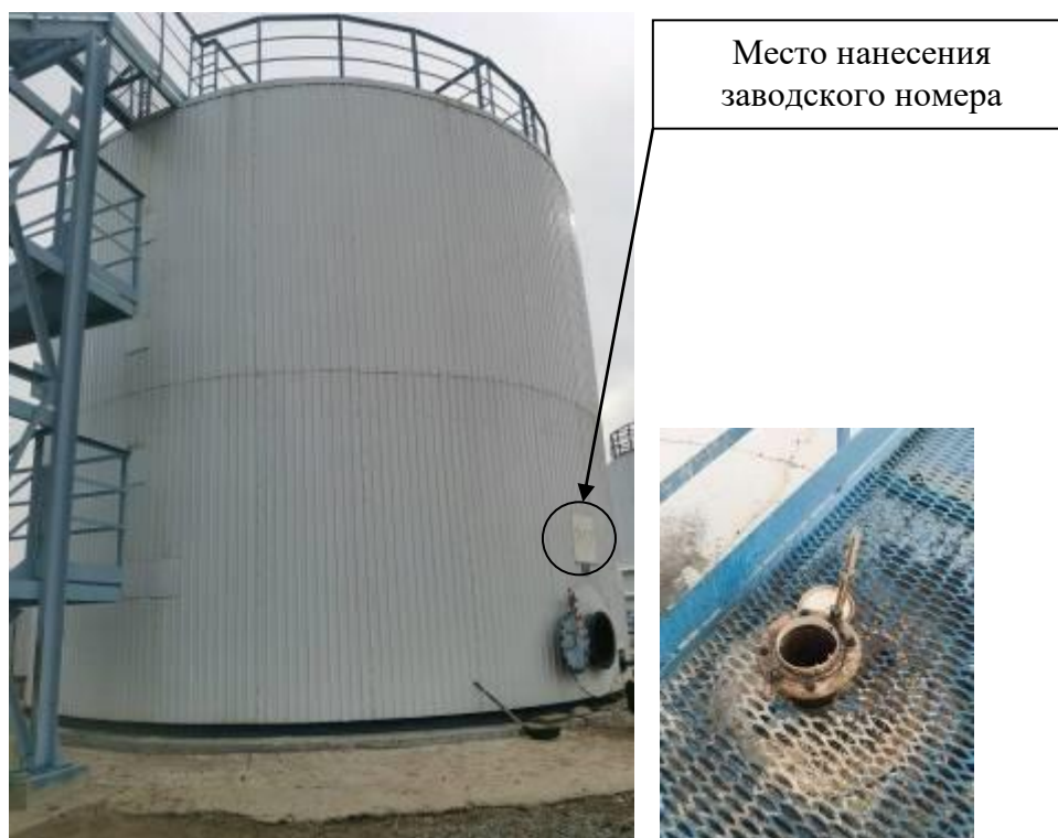
Р и с у н о к 1 – Общий вид резервуара с заводским номером Р17 и его замерного люка