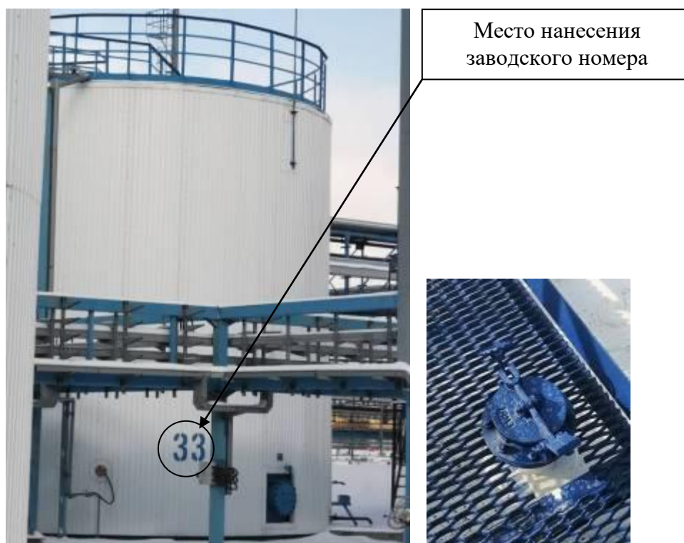
Р и с у н о к 2 – Общий вид резервуара с заводским номером 33 и его замерного люка