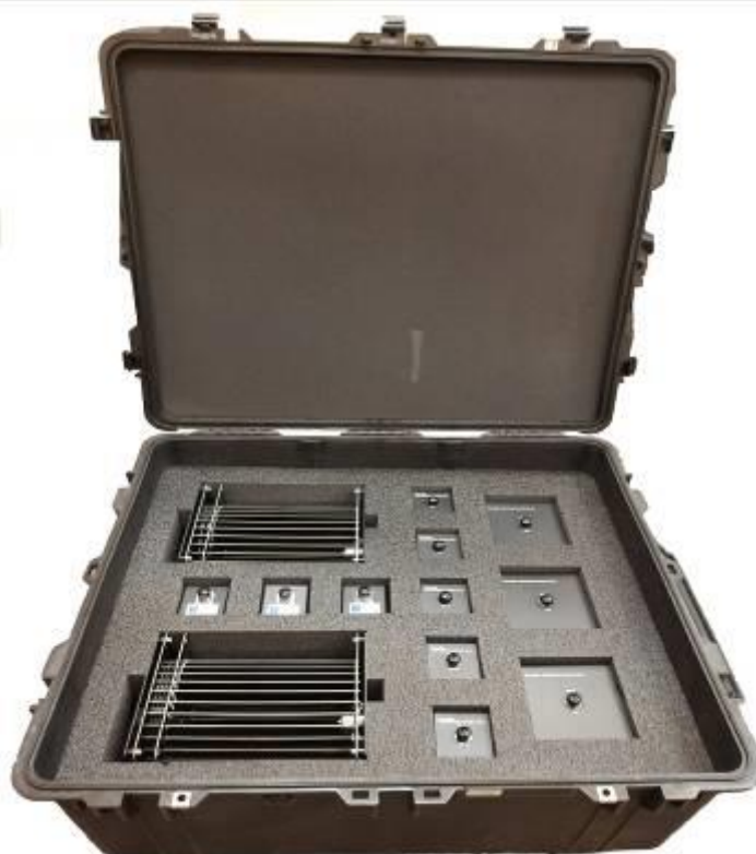
Рисунок 1 - Внешний вид шунтов в транспортном кейсе