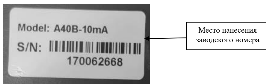
Рисунок 4 – Общий вид маркировочной наклейки, место нанесения заводского номера