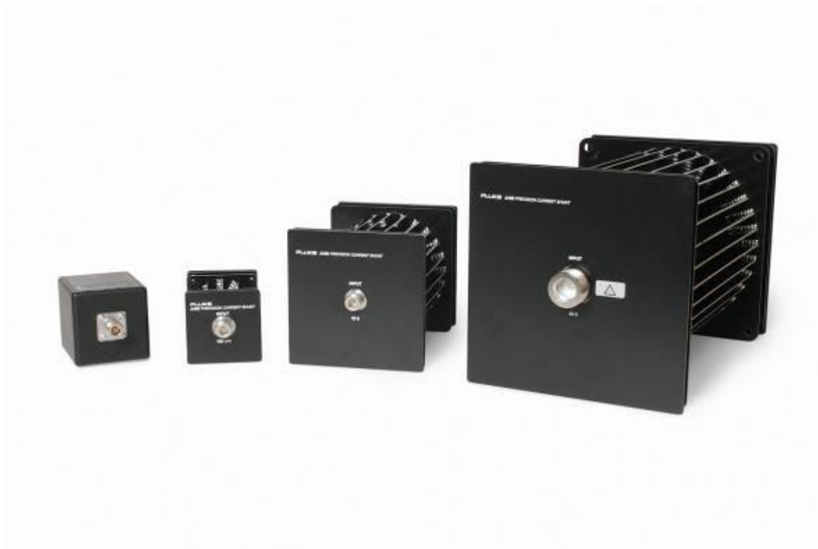
Рисунок 2 - Общий вид шунтов