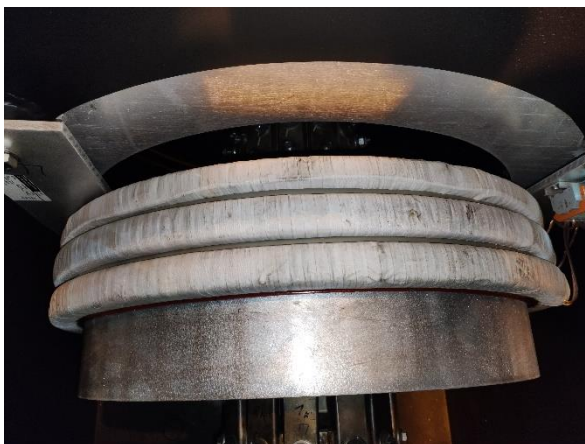
Рисунок 1 – Внешний вид трансформаторов

Общий вид трансформаторов с указанием места нанесения заводского номера и знака утверждения типа приведены на рисунках 1 и 2.