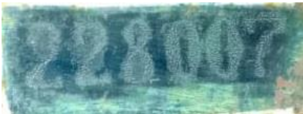
Рисунок 3 – Регистровый номер нефтеналивного судна ТР-7