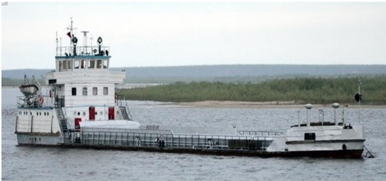
Рисунок 4 –Общий вид нефтеналивного судна TP-7