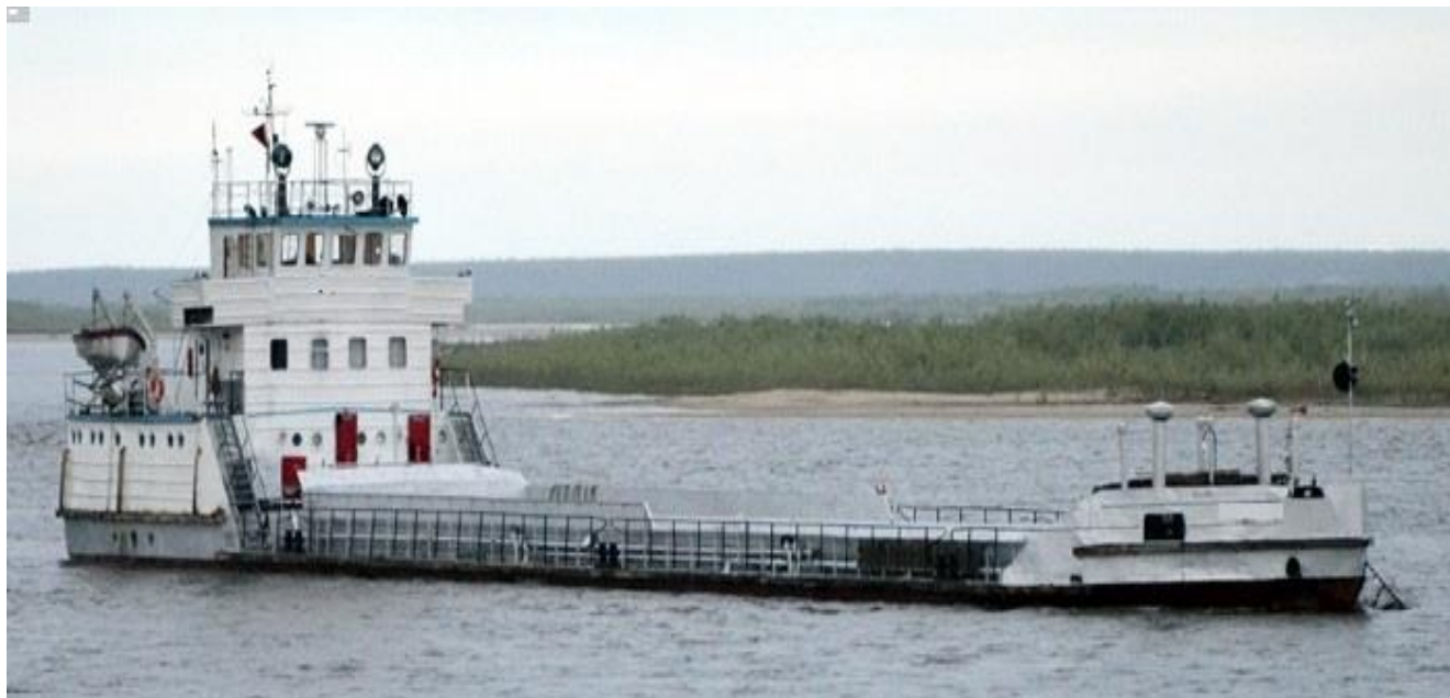
Рисунок 4 –Общий вид нефтеналивного судна Валериан Куйбышев