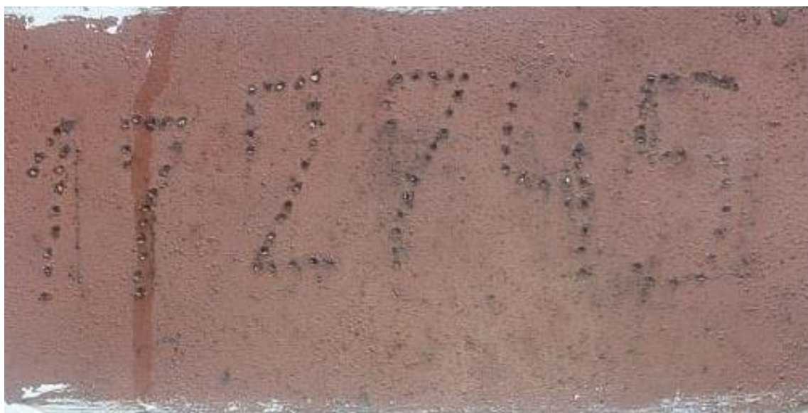
Рисунок 3 – Регистровый номер нефтеналивного судна Валериан Куйбышев