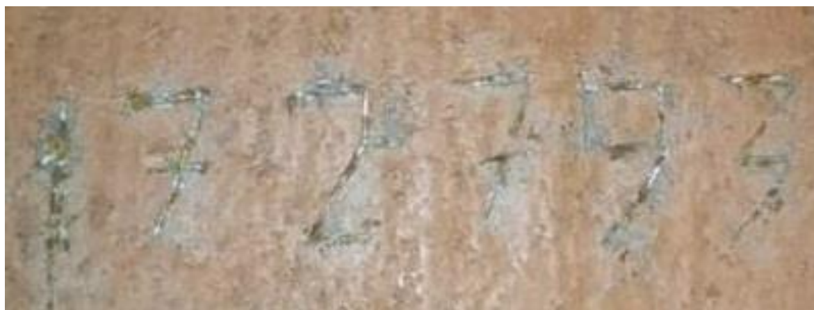
Рисунок 3 – Регистрационный номер нефтеналивного судна ТР-3