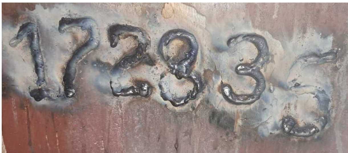
Рисунок 3 – Регистрационный номер нефтеналивного судна ТР-5