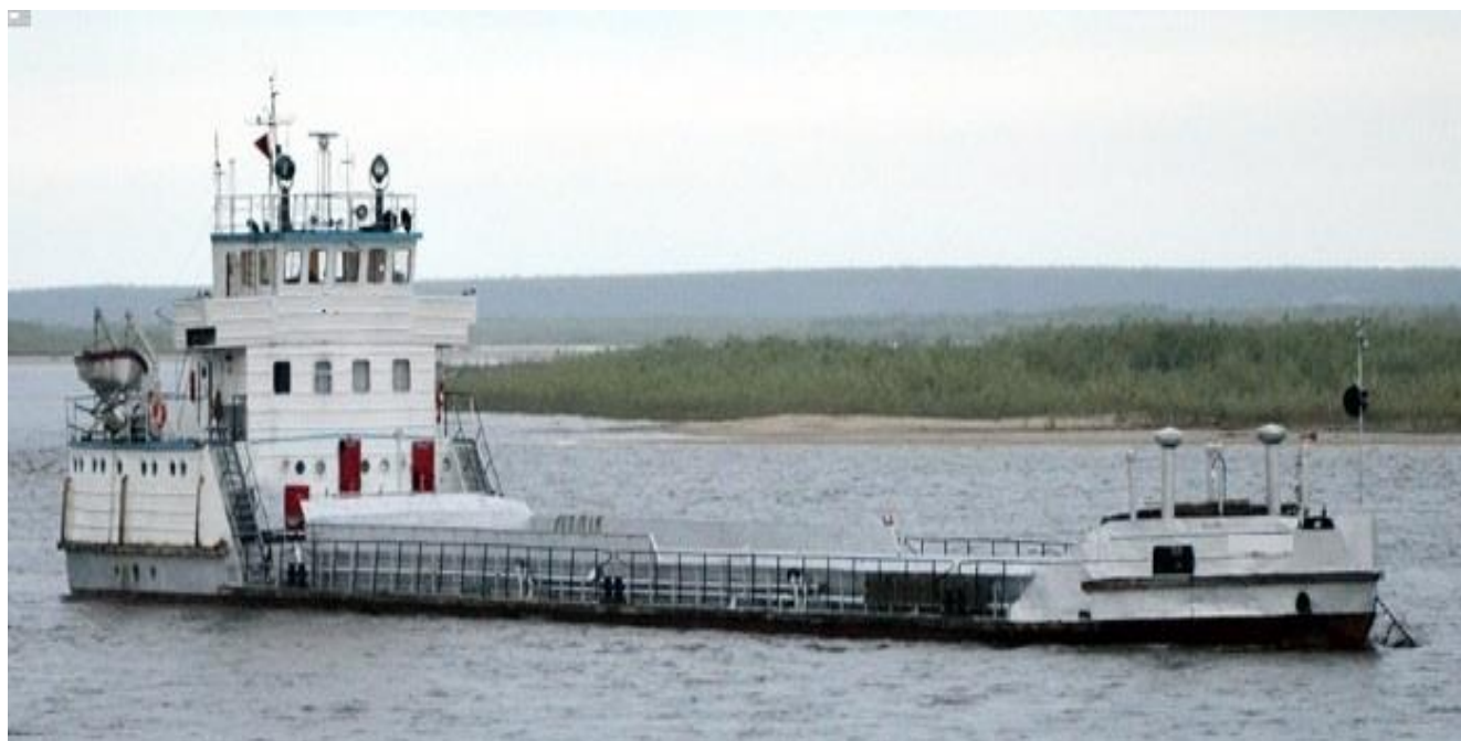
Рисунок 4 –Общий вид нефтеналивного судна TP-5