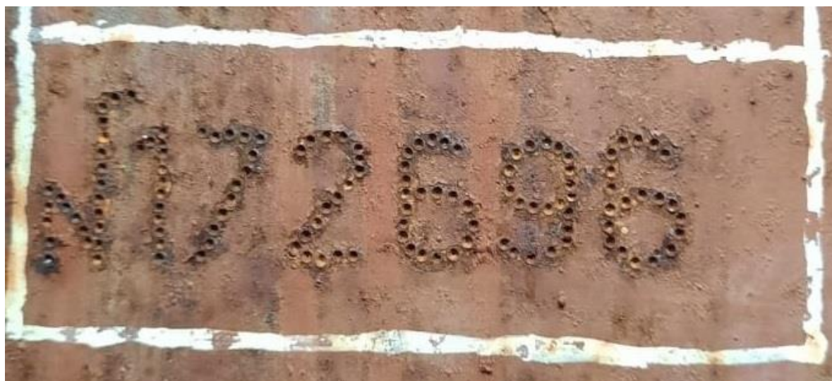
Рисунок 3 – Регистровый номер нефтеналивного судна ТР-1