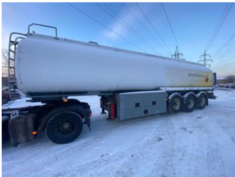
Рисунок 1 – Общий вид полуприцепа-цистерны LAG 0-3-39Т