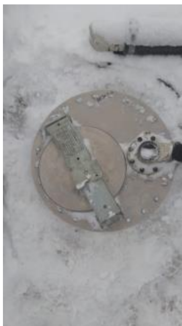
Рисунок 2 – Общий вид крышки горловины полуприцепа-цистерны LAG 0-3-39Т

Схема пломбировки для защиты от несанкционированного изменения положения уровня налива, обозначение места нанесения знака поверки представлены на рисунке 3: