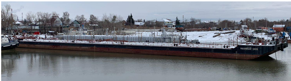
Р и с у н о к 1 – Общий вид несамоходного наливного судна «Наливная-2406»

Общий вид несамоходного наливного судна «Наливная-2406» представлен на рисунке 1.