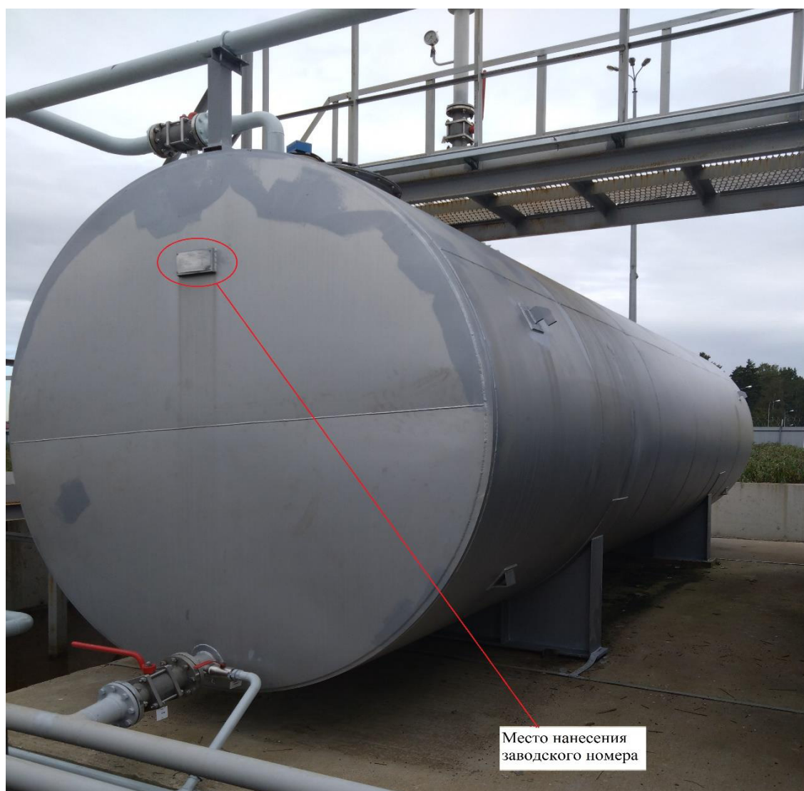
Рисунок 1 – Общий вид резервуаров