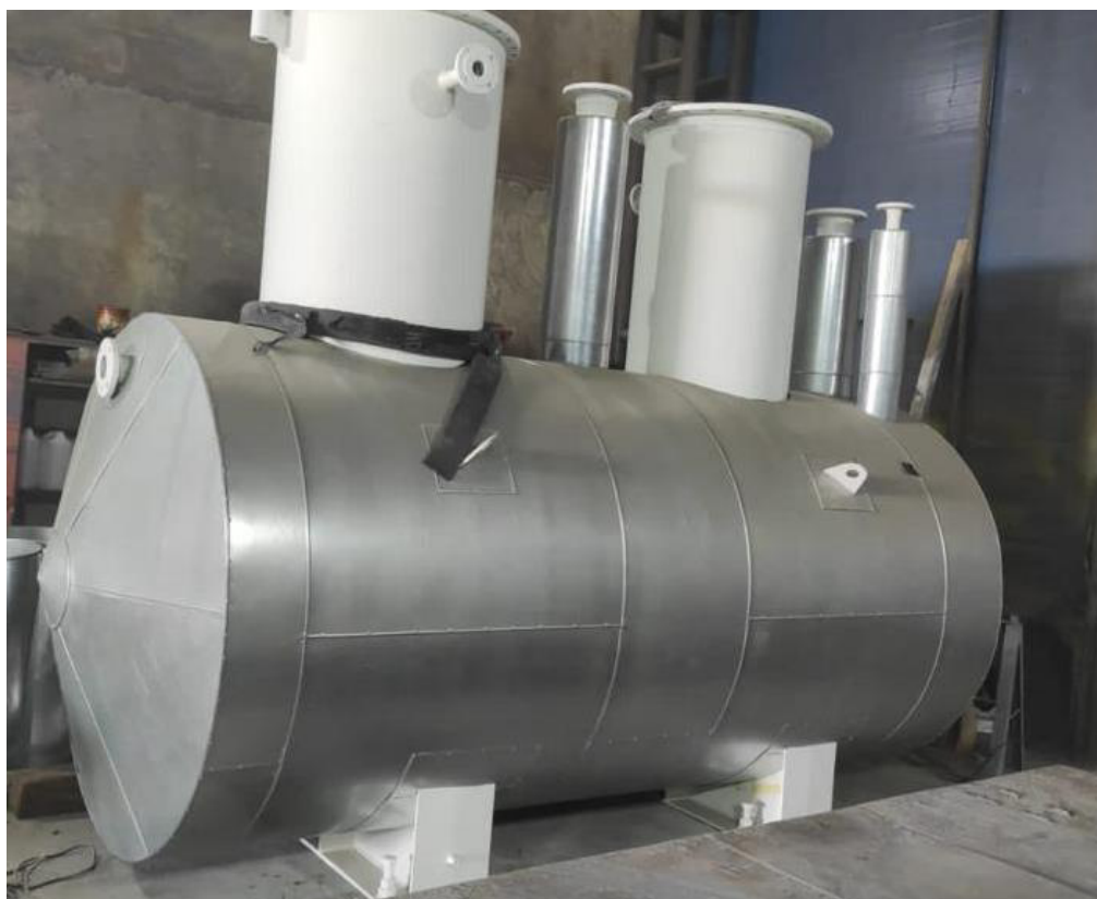
Рисунок 2 – Общий вид резервуара ГКК-1-1-7-0,05 с заводским номером 609

Пломбирование резервуара ГКК-1-1-7-0,05 не предусмотрено.