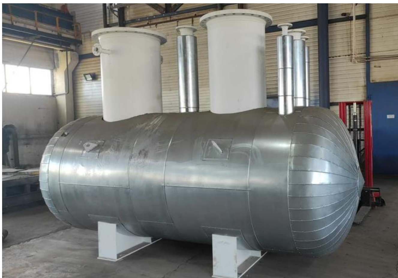
Рисунок 2 – Общий вид резервуара ГЭЭ-1-1-8-1,6-2 с заводским номером 608

Пломбирование резервуара ГЭЭ-1-1-8-1,6-2 не предусмотрено.