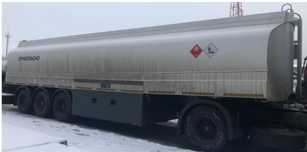
Рисунок 1 – Общий вид полуприцепов-цистерн Eurotank ET-39-6

Схема пломбировки для защиты от несанкционированного изменения положения уровня налива, обозначение места нанесения знака поверки представлены на рисунке 2: