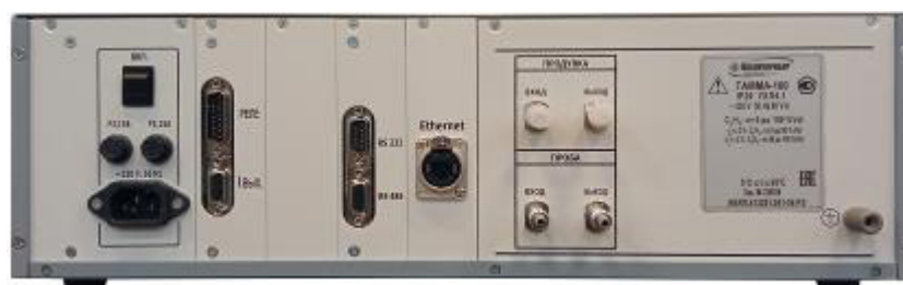
б) вид сзади