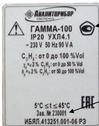
Рисунок 1 – Общий вид газоанализатора ГАММА-100