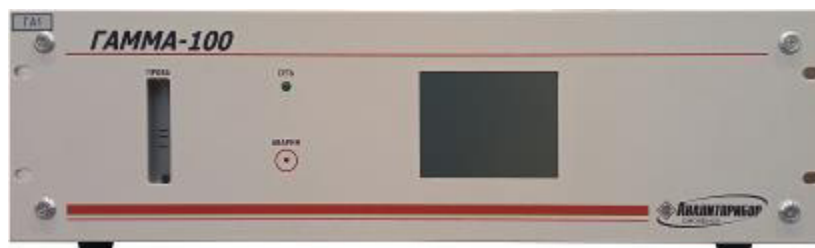
а) вид спереди

Общий вид газоанализатора представлен на рисунке 1, место нанесения заводского номера и знака утверждения типа СИ - на рисунке 2, схема пломбирования - на рисунке 3, способ пломбирования – нанесение замазки уплотнительной У-20А ТУ 38–105375-85 на крепежные винты (согласно схеме на рис. 3), с последующим нанесением оттиска клейма ОТК. Нанесение знака поверки не предусмотрено.