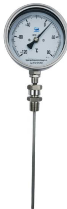
б) исполнения WTQF, WTQFN, WTZF, WTZFN