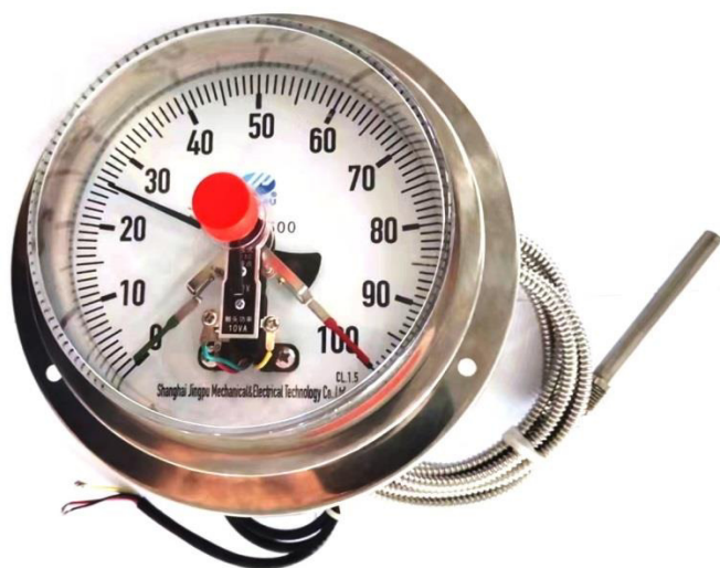
а) исполнения WTQX, WTZX