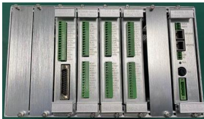
Рисунок 1 – Общий вид контроллеров JNJVS6700M с указанием места нанесения заводского номера