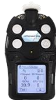
в) модификация Бинар-ХХПХ (Бинар-1ХПХ, Бинар-2ХПХ, Бинар-3ХПХ, Бинар-4ХПХ, Бинар-5ХПХ)