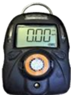
а) модификация Бинар-1 Х ДХ

Пломбирование и нанесение знака поверки на газоанализаторы не предусмотрено. Газоанализаторы имеют заводские номера, которые в виде цифрового обозначения, состоящего из арабских цифр, наносятся печатным способом на идентификационную наклейку (рисунок 2), закрепленную на задней панели газоанализаторов.