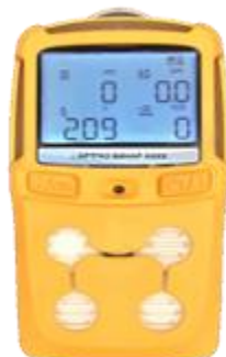
б) модификация Бинар-ХХДХ (Бинар-1ХДХ, Бинар-2ХДХ, Бинар-3ХДХ, Бинар-4ХДХ, Бинар-5ХДХ)