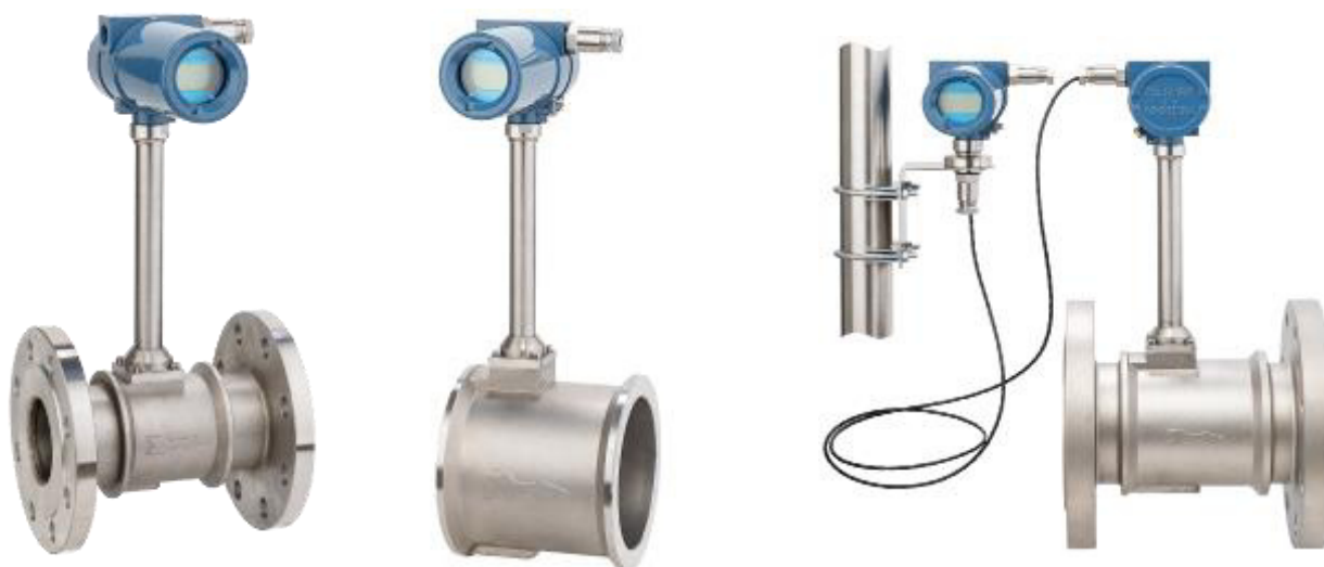
С преобразователем интегрального монтажа

Расходомеры изготавливаются в общепромышленном и взрывозащищенном исполнениях.