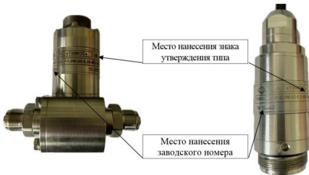
Рисунок 4 – Общий вид преобразователей давления ТИМОС, модификации ТИМОС-ДД-Р