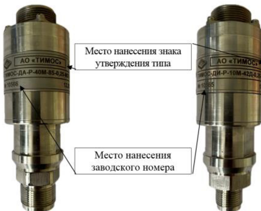
Рисунок 2 – Общий вид преобразователей давления ТИМОС, модификации ТИМОС-ДА-Р

Общий вид преобразователей с указанием мест нанесения знака утверждения типа и заводского номера приведен на рисунках 2-7.