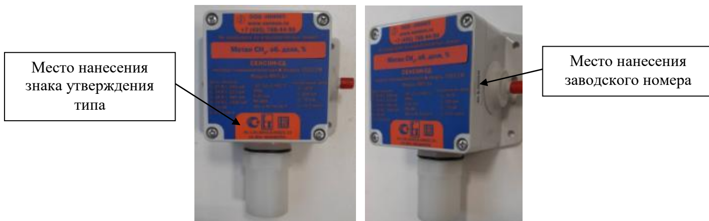
Рисунок 1 - Общий вид исполнения MKT-1п, с указанием места нанесения знака утверждения типа, места нанесения заводского номера