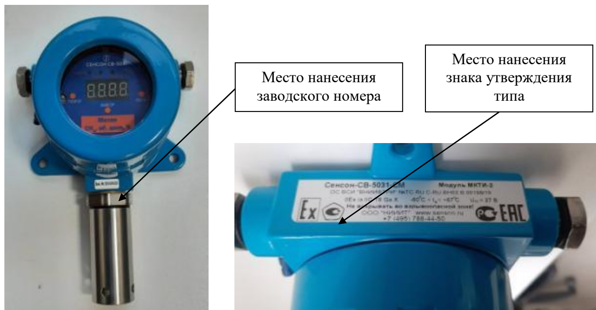
Рисунок 7 - Общий вид исполнения МКТИ-2, с указанием места нанесения знака утверждения типа, места нанесения заводского номера