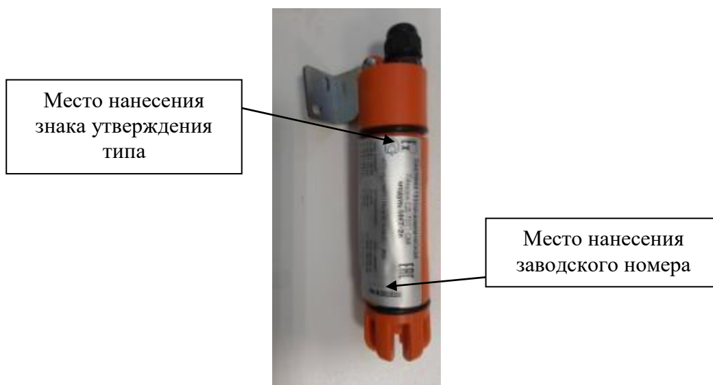
Рисунок 3 - Общий вид исполнения MKT-2п, с указанием места нанесения знака утверждения типа, места нанесения заводского номера