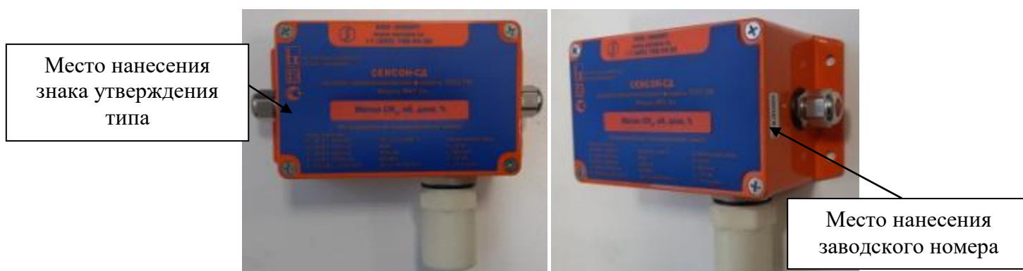
Рисунок 2 - Общий вид исполнения MKT-2м, с указанием места нанесения знака утверждения типа, места нанесения заводского номера