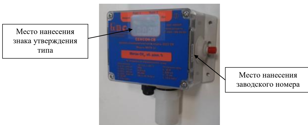
Рисунок 6 - Общий вид исполнения МКТИ-1п, с указанием места нанесения знака утверждения типа, места нанесения заводского номера