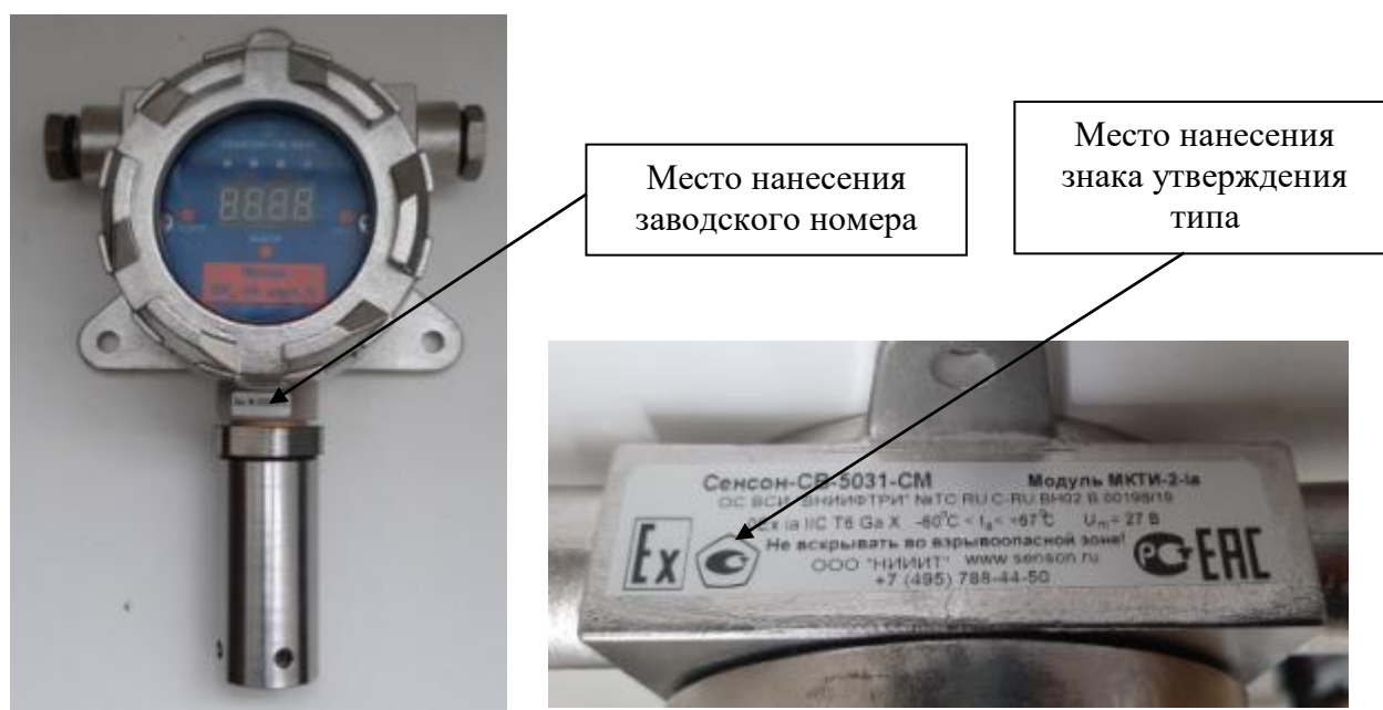
Рисунок 8 - Общий вид исполнения МКТИ-2-ia, с указанием места нанесения знака утверждения типа, места нанесения заводского номера