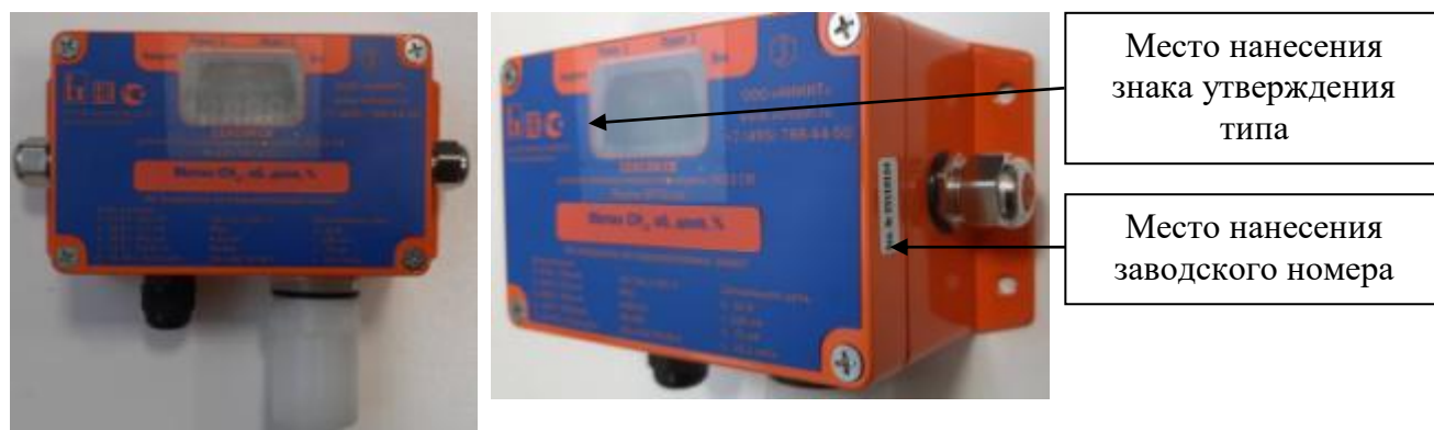
Рисунок 5 - Общий вид исполнения МКТИ-1м, с указанием места нанесения знака утверждения типа, места нанесения заводского номера