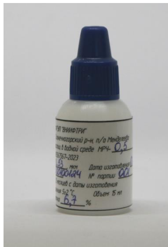
Рисунок 1 – Общий вид мер размеров частиц в водной среде МРЧ-0,5