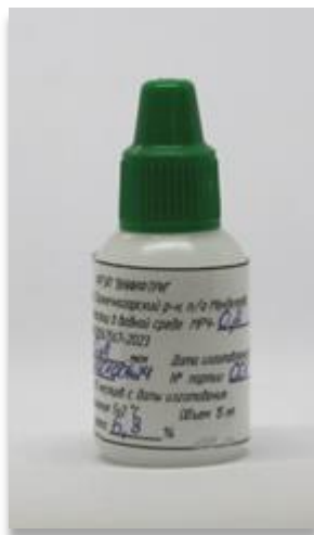
Рисунок 1 – Общий вид мер размеров частиц в водной среде МРЧ-0,2