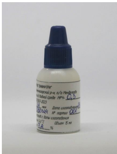
Рисунок 1 – Общий вид мер размеров частиц в водной среде МРЧ-0,3