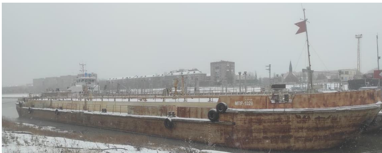
Р и с у н о к 1 – Общий вид несамоходного наливного судна МПР-1028

Общий вид несамоходного наливного судна МПР-1028 представлен на рисунке 1.