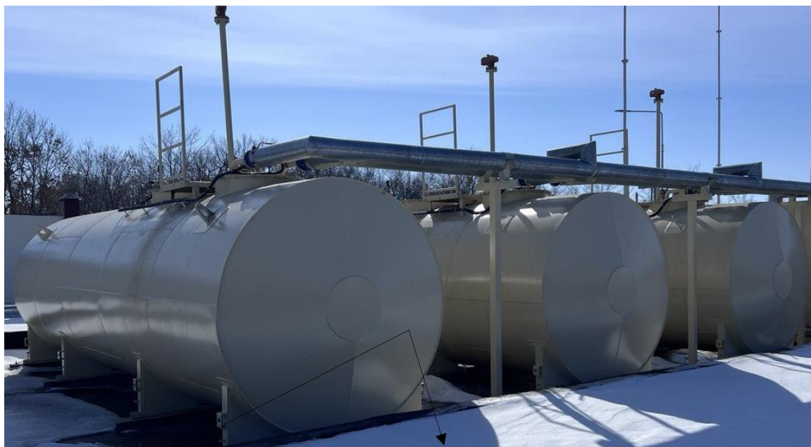
Рисунок 1 – Общий вид резервуаров