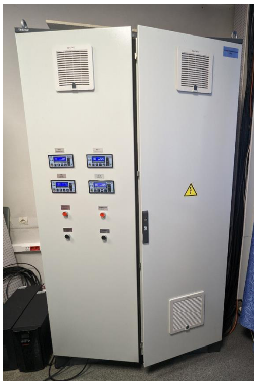
Рисунок 1 – Шкаф с оборудованием Комплекса