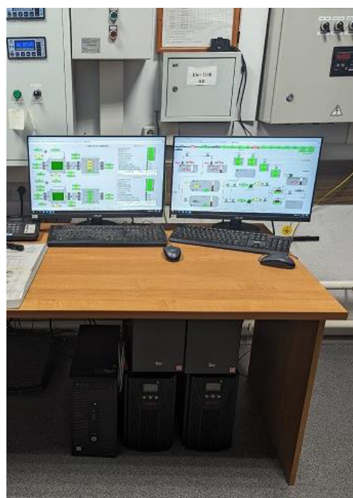
Рисунок 3 – Основная и резервная рабочие станции оператора