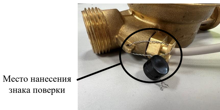
Рисунок 2 – Место пломбирования теплосчетчика