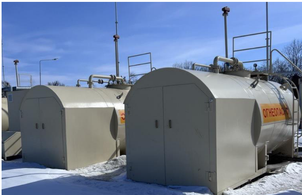
Рисунок 1 – Общий вид резервуаров