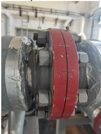
а) фланец калиброванного участка

Знак поверки наносится на пломбы, установленные в соответствии с рисунком 2.