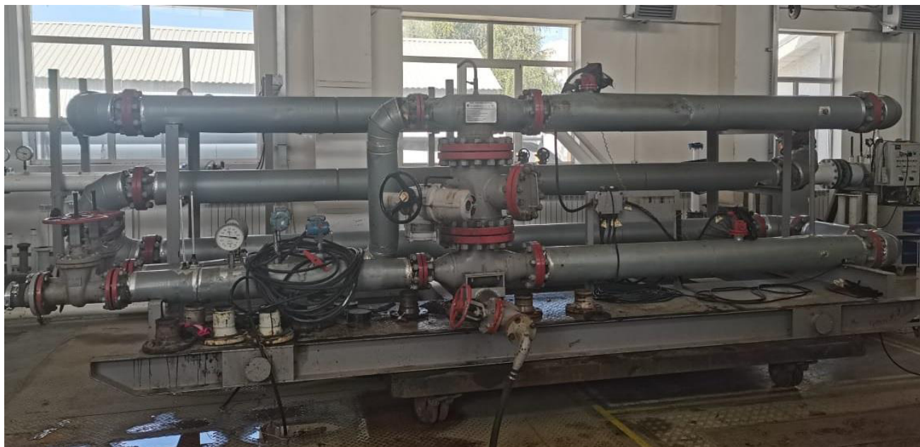
Рисунок 1 – Общий вид ТПУ

Установка пломб на ТПУ осуществляется с помощью контровочной проволоки и свинцовой (пластмассовой) пломбы с нанесением знака поверки давлением на пломбы, установленные: