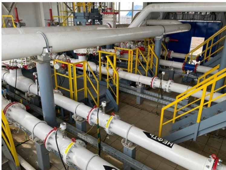
Рисунок 1 - Общий вид СИКН

Общий вид СИКН представлен на рисунке 1.