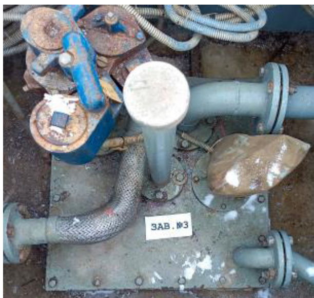
Рисунок 4 – Горловина резервуара РГС-60 зав.№ 3

Пломбирование резервуаров РГС не предусмотрено.