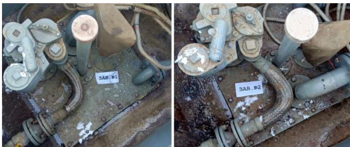
Рисунок 2 – Горловины резервуаров РГС-50 зав.№№ 1, 2