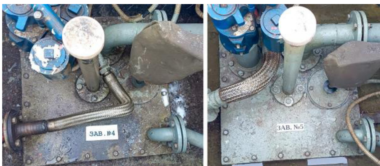
Рисунок 3 – Горловины резервуаров РГС-50 зав.№№ 4, 5