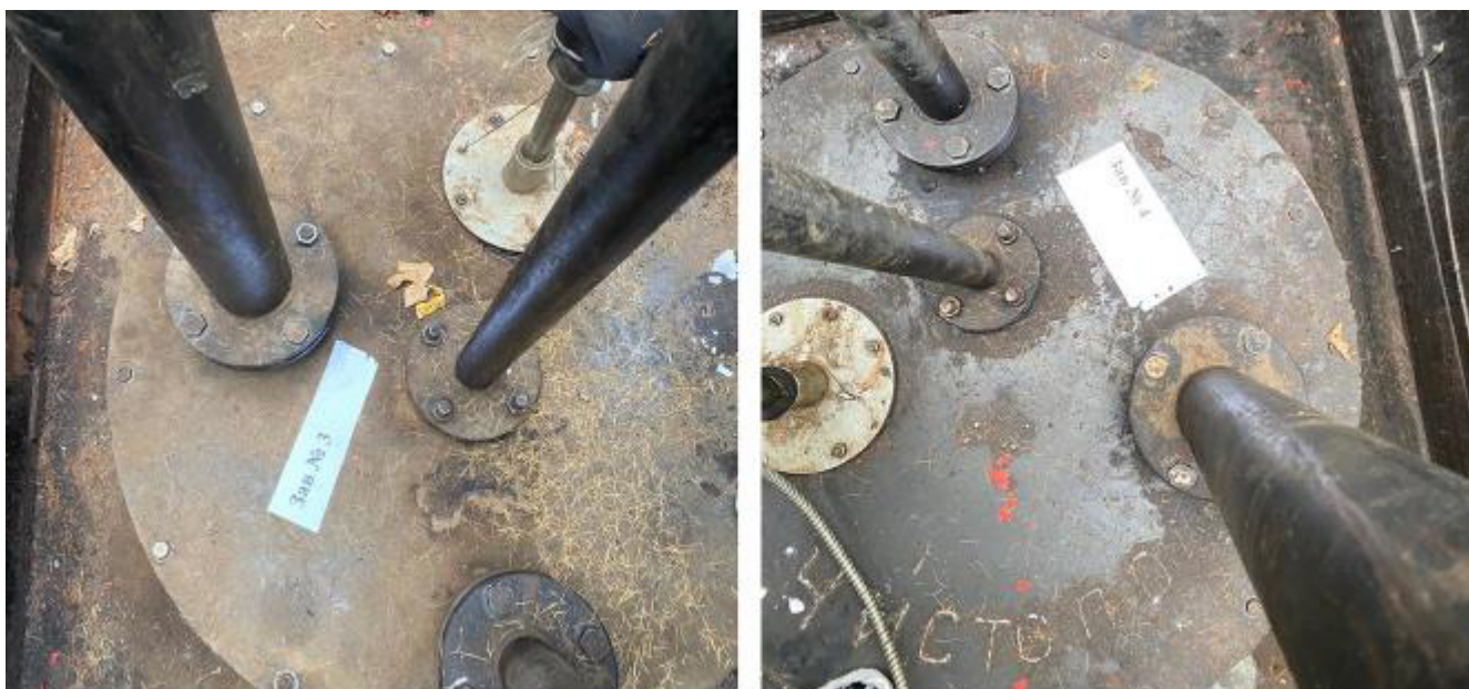
Рисунок 3 – Горловины резервуаров РГС-55 зав.№№ 3, 4

Пломбирование резервуаров РГС-55 не предусмотрено.