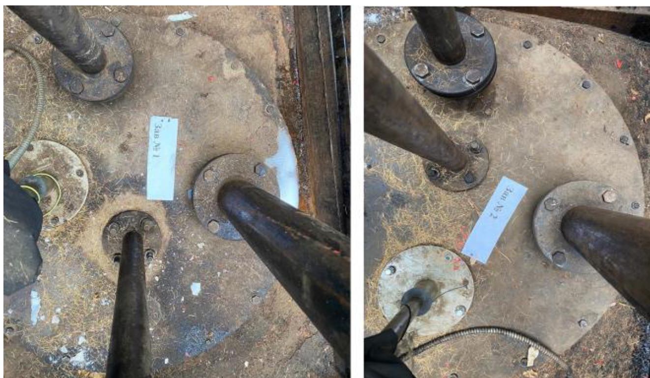
Рисунок 2 – Горловины резервуаров РГС-55 зав.№№ 1, 2