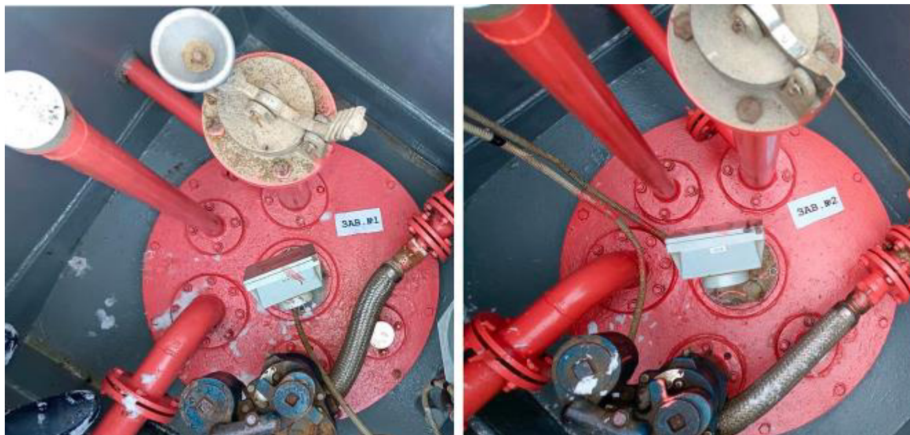
Рисунок 4 – Горловины резервуаров РГС-25 зав.№№ 1, 2

Пломбирование резервуаров РГС не предусмотрено.