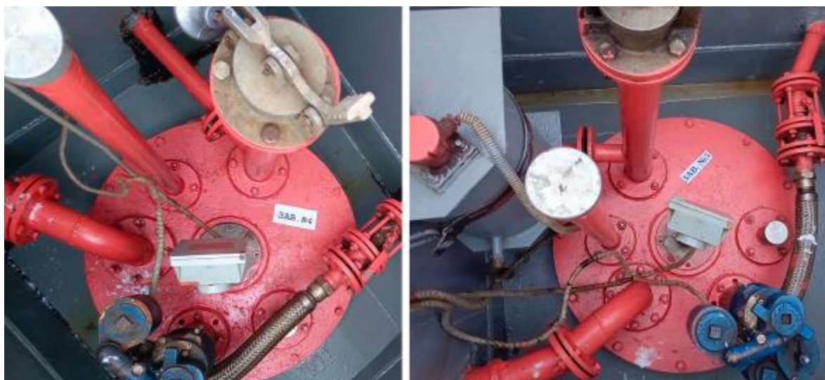
Рисунок 2 – Горловины резервуаров РГС-15 зав.№№ 4, 5