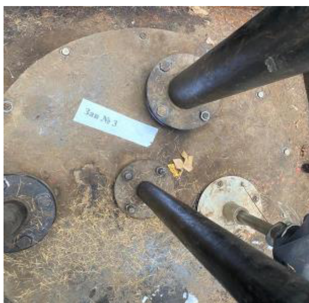
Рисунок 3 – Горловина резервуара РГС-25 зав.№ 3

Пломбирование резервуаров РГС-25 не предусмотрено.