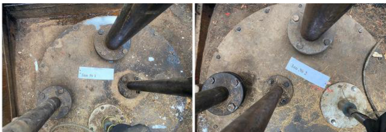
Рисунок 2 – Горловины резервуаров РГС-25 зав.№№ 1, 2