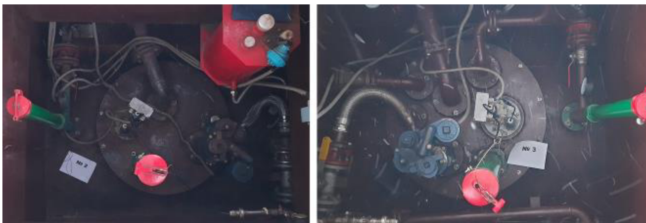
Рисунок 2 – Горловины резервуаров РГС-30 зав.№№2, 3