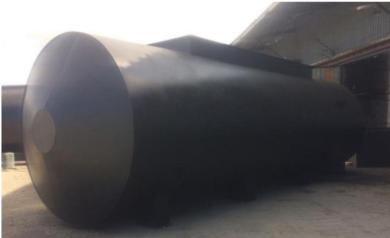
Рисунок 2 – Общий вид резервуара

Пломбирование резервуара РГСп 50(35+15) не предусмотрено.